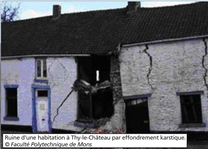
Ruine d'une habitation à Thy-le-Château par effondrement karstique.